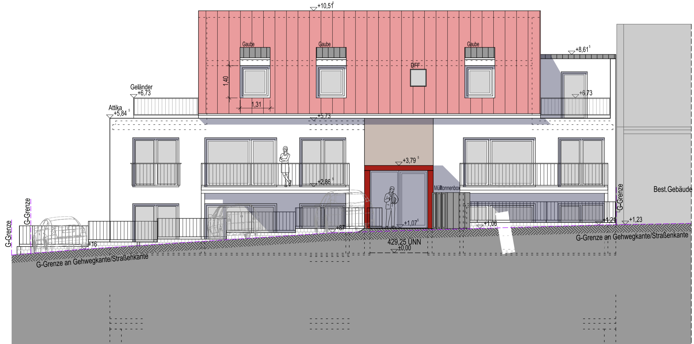
Westen Ansicht/Schnitt G-Grenze Gehweg-Straße